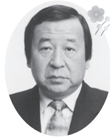
会 多 間 和 多 会 長 和 多

会員の皆様には健やかに新年をお迎えのことと拝察し心よりお慶び申し上げます。さて、日本経済は回復基調にあると同時に、雇用も確実に改善しております。しかし、